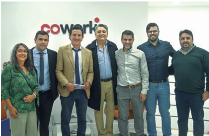
📷 Junto a autoridades del Ministerio de Transporte y Obras Públicas.

de Atlántida, entre otras. Al respecto indicó que “nosotros siempre tratamos de ser ese nexo, ese hub entre las políticas de los gobiernos y nuestras empresas. A veces la dificultad de las empresas es acceder a muchas herramientas que tiene el gobierno, y por parte de éste, lograr llegar a cada una de esas empresas. Entonces nosotros nos empeñamos en cumplir ese rol”.