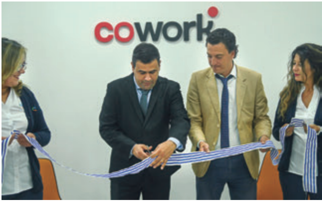
📷 Un instante del tradicional corte de cinta