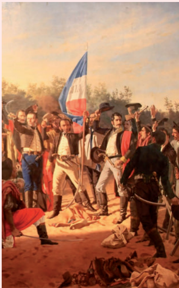
📖 Recorte del cuadro de Blanes.