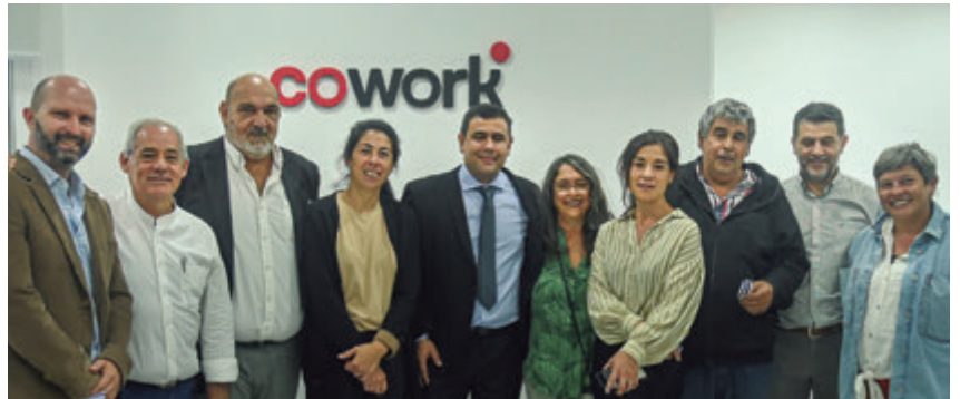
📷 Junto a representantes del Gobierno de Canelones y el Municipio local.