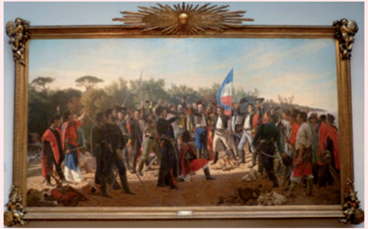
📷 Juramento de los Treinta y Tres Orientales - J.M. Blanes.

pastando libremente por donde se les antojara, ya que tampoco había alambrados que les impidieran el paso.