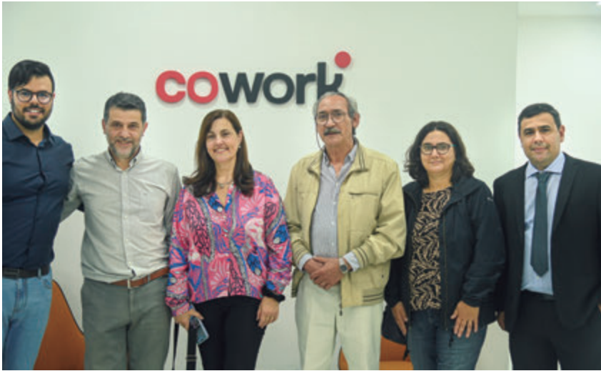
📷 Representantes del Ministerio de Transporte y Obras Públicas.