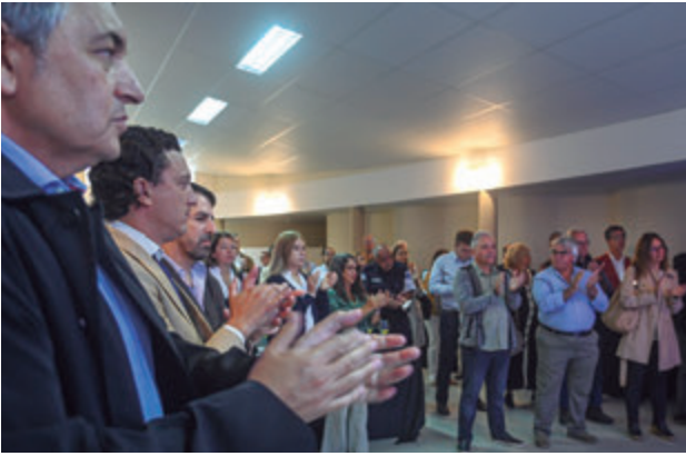
📷 El público en nuestro salón social.