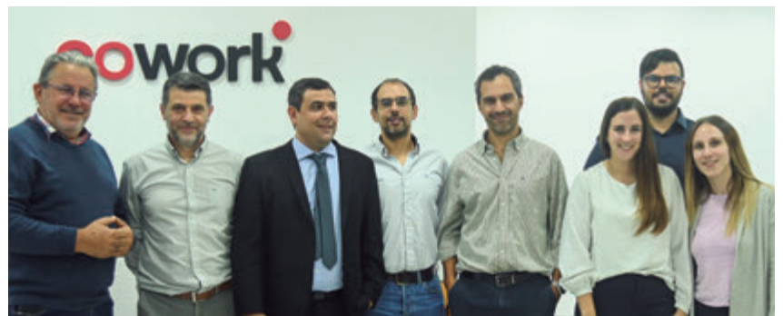
📷 Los colegas de la Cámara Empresarial Canaria Presente.