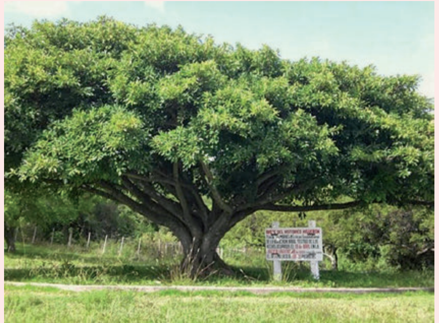
📍 Los Higuerones de La Agraciada.