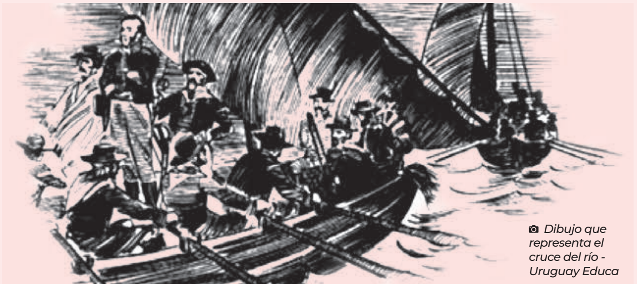
📷 Dibujo que representa el cruce del río