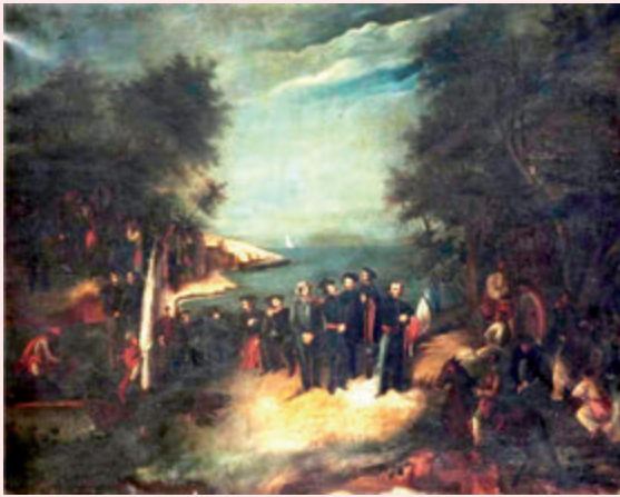
📷 Óleo de Josefa Palacios - 1854.