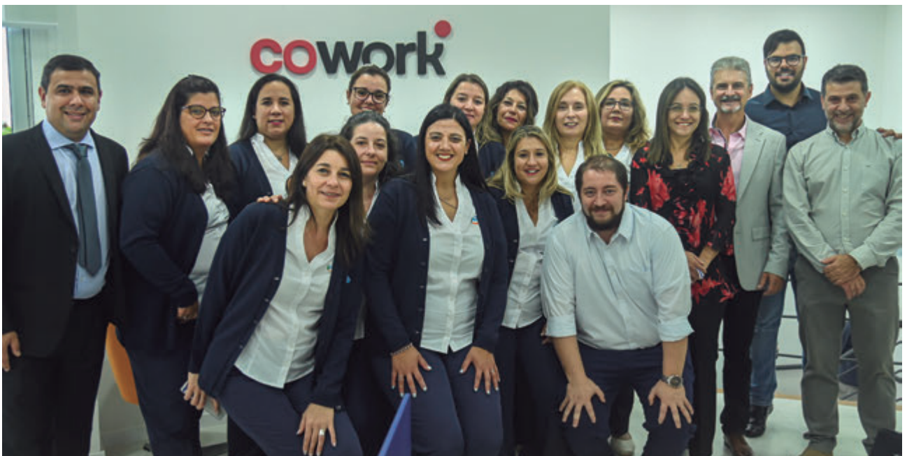
📷 Funcionarios y miembros de la directiva de CCIFA

ámbitos. Entre ellas, el Ministerio de Transporte y Obras Públicas, Ministerio de Turismo, el Gabinete Productivo del Gobierno de Canelones, el municipio local, representantes del Centro PYME de Canelones, la Cámara Empresarial Canaria, la Asociación Turística de Canelones y la Asociación de Jubilados y Pensionistas