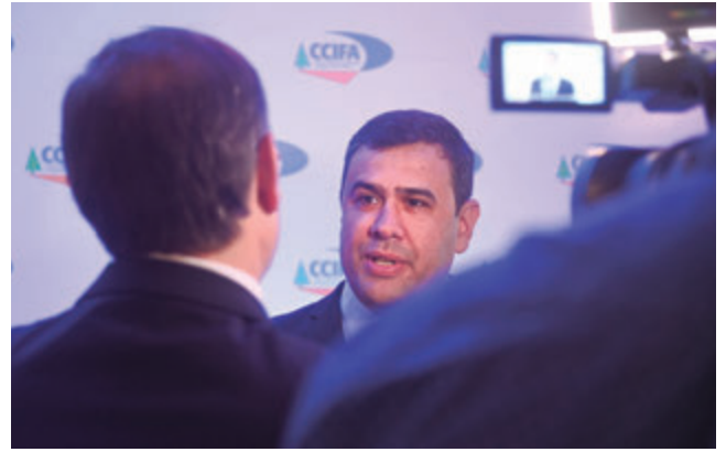
📷 El Presidente Camilo Uhalde en entrevista.

no es el mismo departamento de hace 15 o 20 años atrás, y este centro comercial es una muestra de las cosas que se han venido haciendo bien en Canelones”.