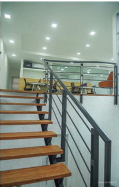
📷 Accesos al sector de Cowork.