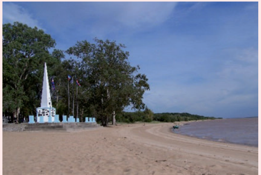
📍 Monumento conmemorativo en Agraciada.

Vueltos a la isla de Brazo Largo, esperaron el arribo de la segunda